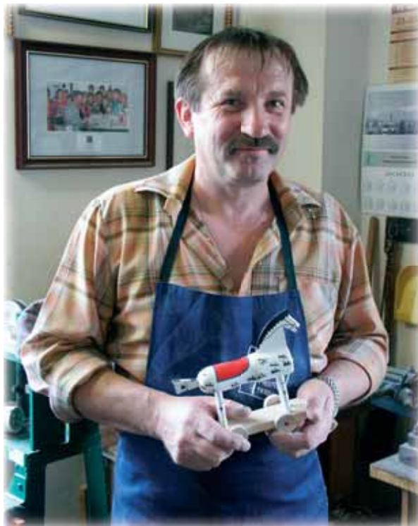
... výroba soustružených hraček