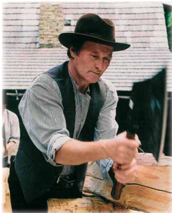
... tesařská a sekernická výroba