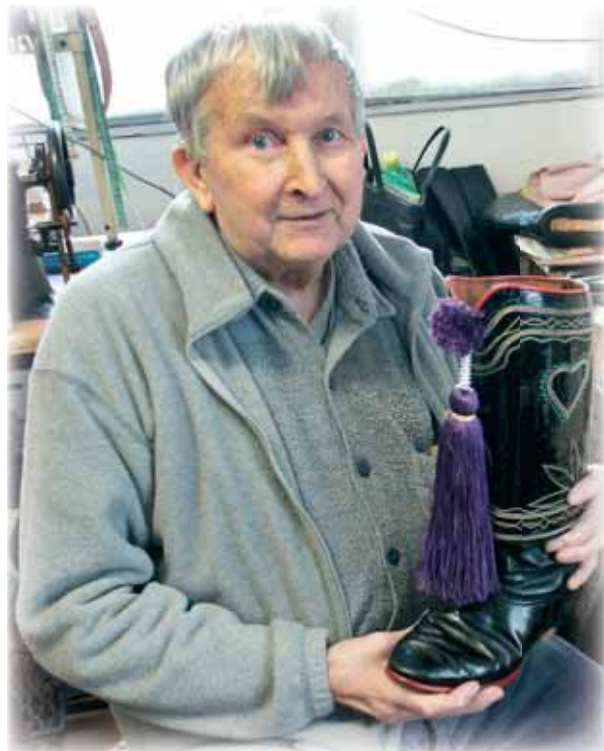
... výroba krojové obuvi