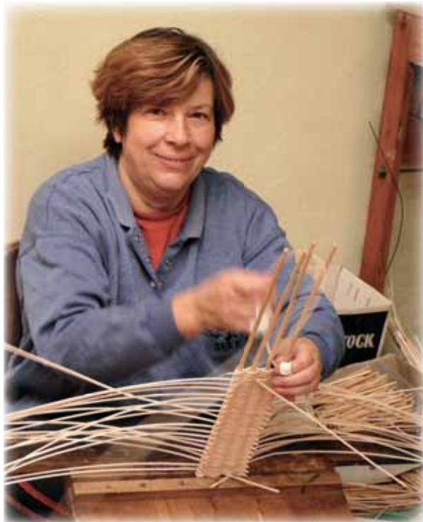
... pletení z proutí a pedigu