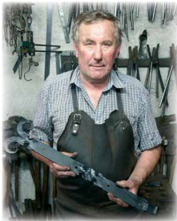
... kovářská výroba