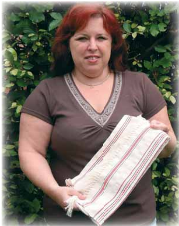
... tkaní na stavu