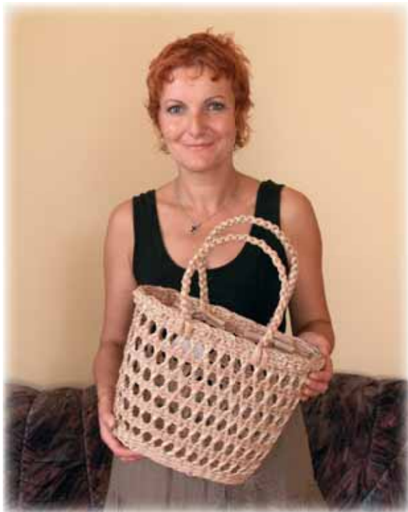
... pletení z orobince