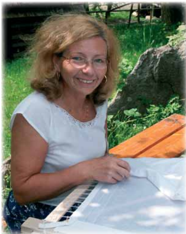
... bílé vyšívání