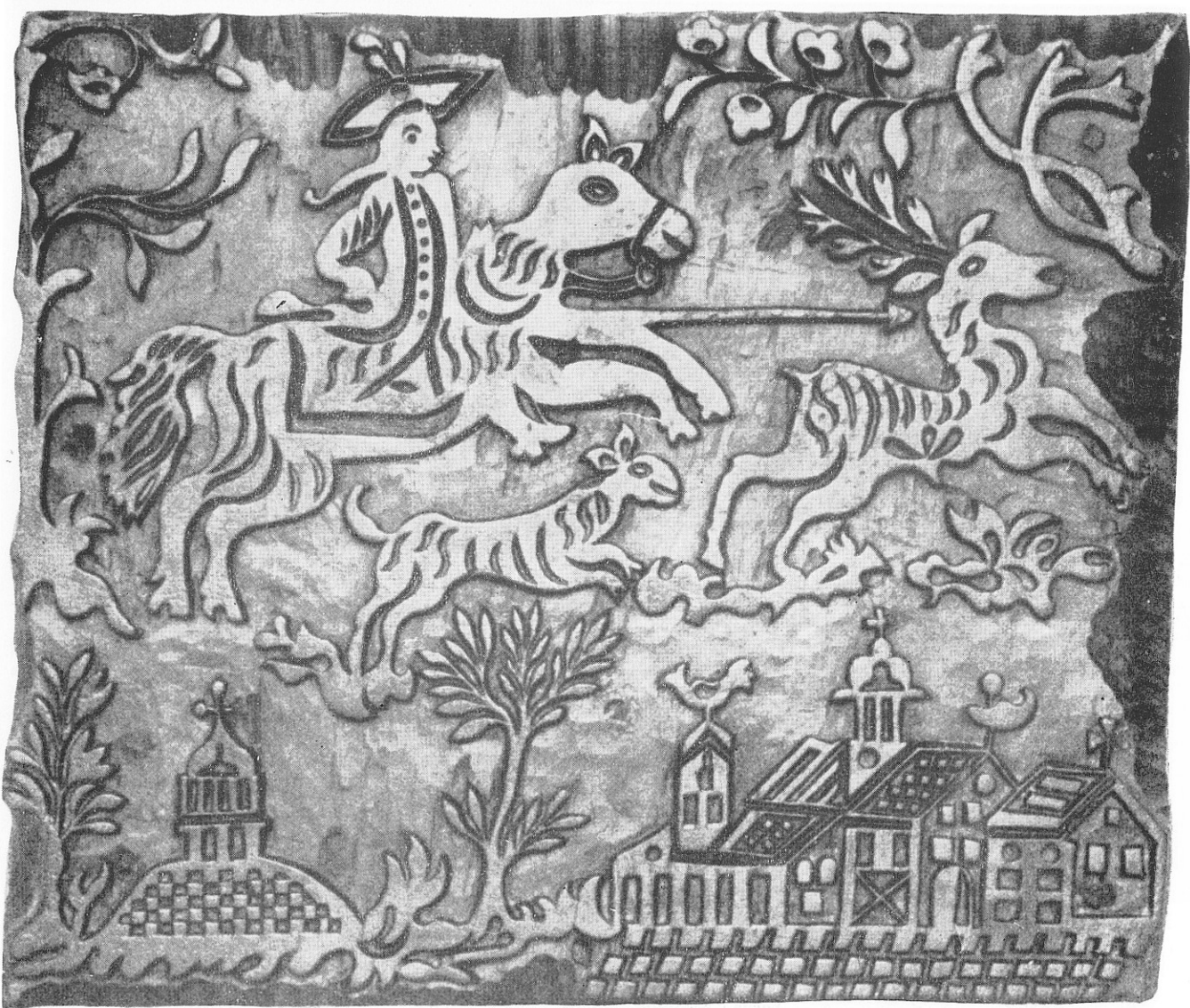
△ 6/ Modrotisková forma, figurální motiv s loveckou scénou, dřevo, 18. stol., 4,2 × 29,5 × 24,5 cm, Vlastivědný ústav Olomouc, inv. č. E 20003