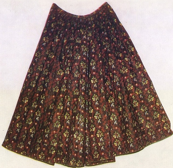
Δ 4/ Sukně, vícebarevný uničovský tisk, 19. stol., Haná, 410 × 90 cm, Vlastivědný ústav Olomouc, přír. č. 72/69